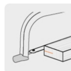
Corte a 180°