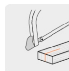
Corte a 90°