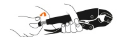
Apertura máxima de la mordaza