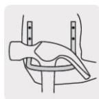
Gancho de acero para martillo