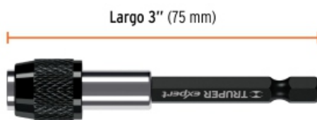
Largo 3" (75 mm)